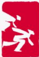
Patinação de velocidade em pista curta