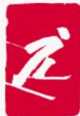
Esqui cross- country