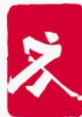
Hóquei no gelo